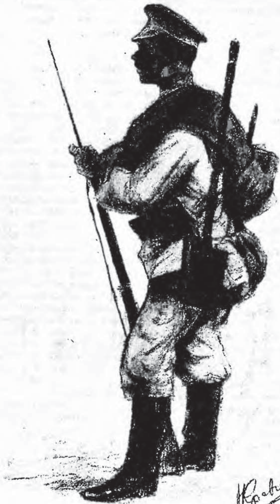
«Пехотинец». Рисунок Н. Кравченко