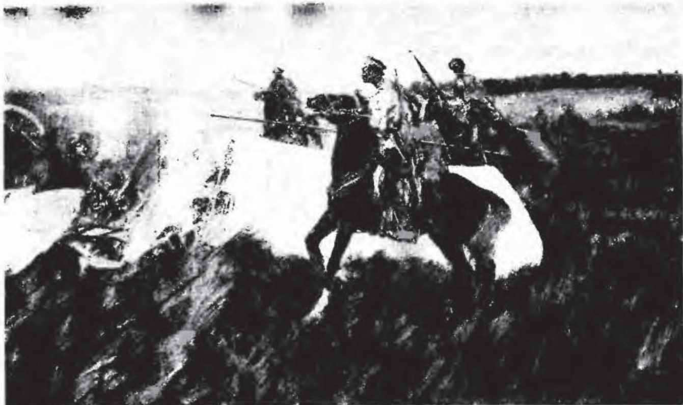
«Подстреленный аэроплан». Рисунок И. Владимирова

бить палками бегущих и стрелять по ним, и на следующий день команда разведчиков, расположившись с тыла, удержала полк, а полк – позиции.