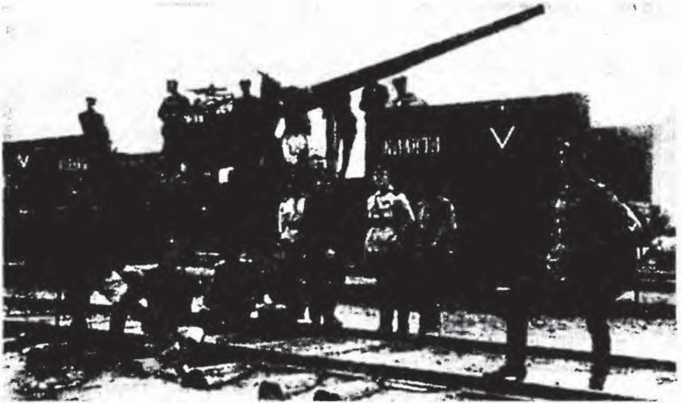
Бронепоезд Добровольческой армии «Иоанн Калита», 1919 год

нилову, которого называл «человек-легенда». Чувствуя родство двух сильных характеров – своего и корниловского, – он вовсе не распространял свое отношение на окружение Лавра Георгиевича, не раз упоминая М. В. Алексева, А. И. Деникина, И. Г. Эрдели, что называется, скопом, как бы подчеркивая их равнозначность между собой и второстепенность рядом с Корниловым. Отсюда и слова о потере цели: Дроздовский был готов бороться, но не видел теперь настоящего вождя.