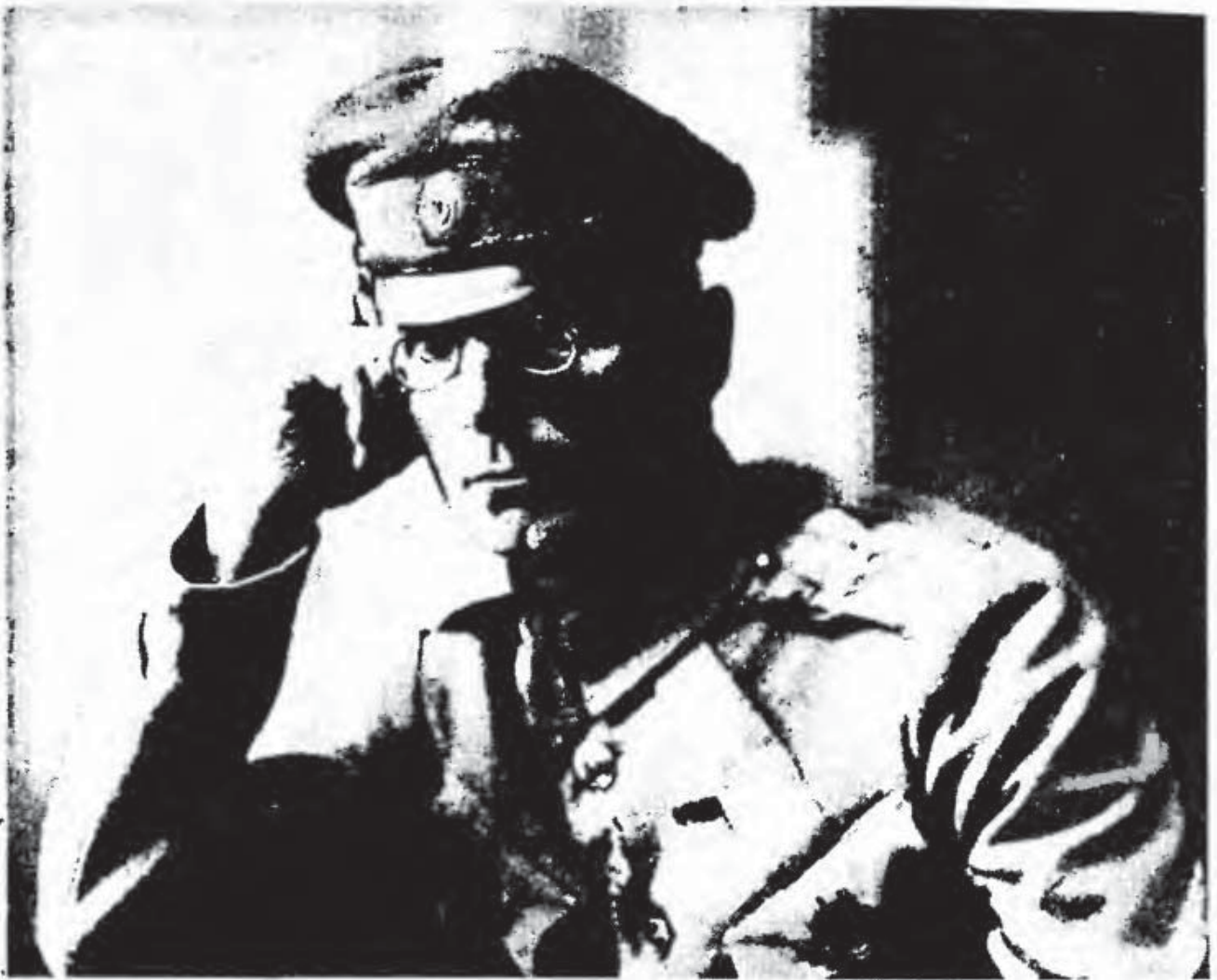
Полковник М.Г. Дроздовский

ло разоружение русских добровольцев. Дроздовский, еще за несколько дней до этого решивший в таком случае прорываться на восток, лихорадочно готовился к выступлению. Румыны, на словах соглашаясь пропустить его, саботировали выдачу имущества и задерживали эшелоны; Щербачев, получивший от союзников 7 миллионов франков, согласился выделить полтора, а на деле выплачено оказалось лишь 600 тысяч. Для пополнения кассы Дроздовский решил продавать часть снаряжения и техники. Установив денежное содержание в 200 рублей в месяц офицерам и от 25 до 100 рублей солдатам, он не считал возможным нарушать свои обязательства.