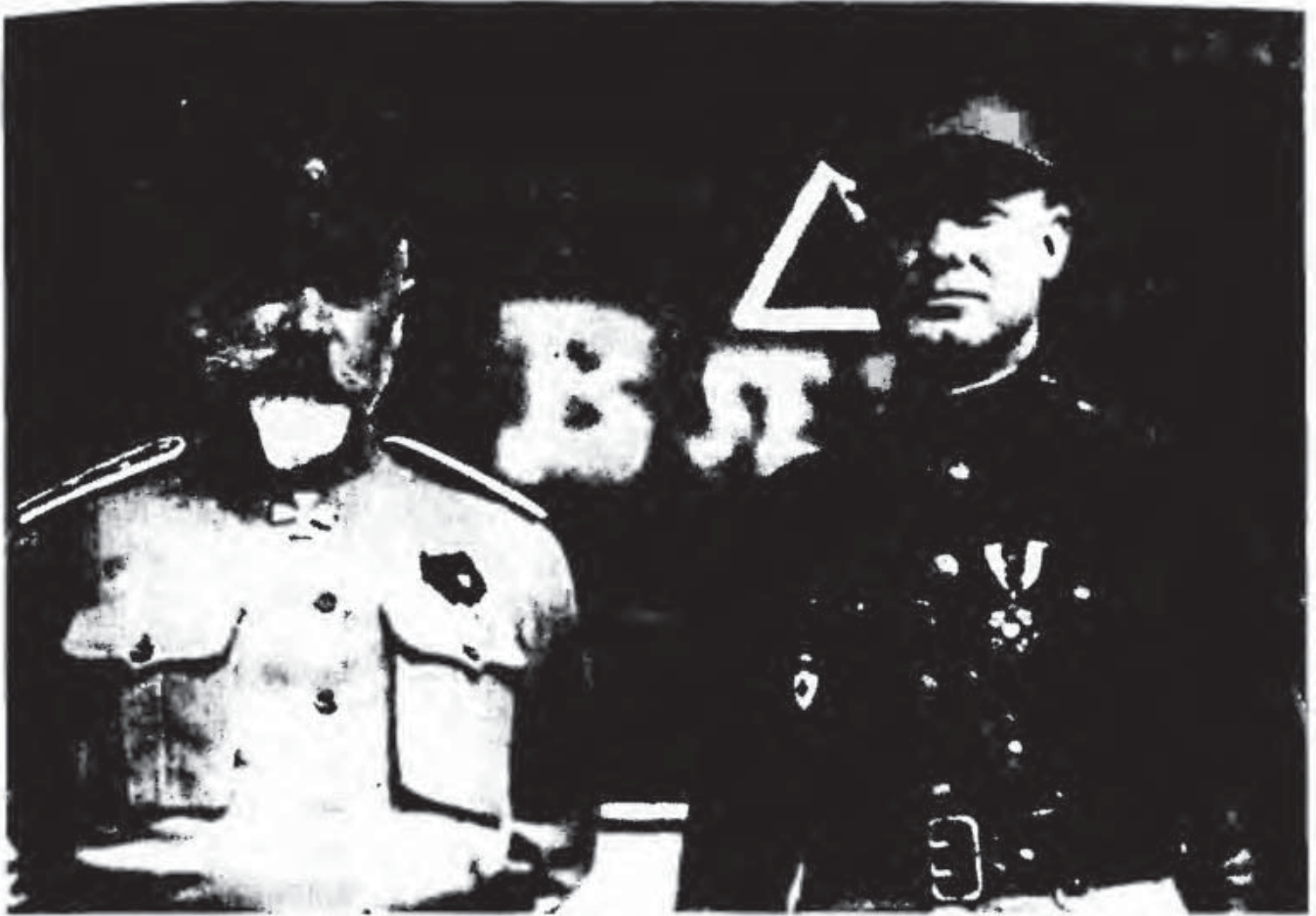
А.И. Деникин с американским офицером

гов; почти все артиллеристы были ранены, но из боя не вышли. Начало атаки затягивалось.